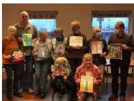
Foto van de Schilderworkshop die gehouden is door de Cultuurgroep